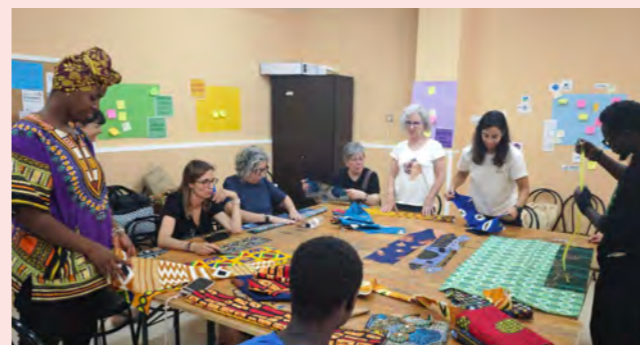
Taller de costura amb teles africanes "wax"

L'Aixolet va celebrar el seu quart aniversari amb una setmana plena d'activitats: sortides, tallers, ioga, costura africana i molt més. Un homenatge a la comunitat que dia a dia "llaura" vincles, projectes i alegria col·lectiva.