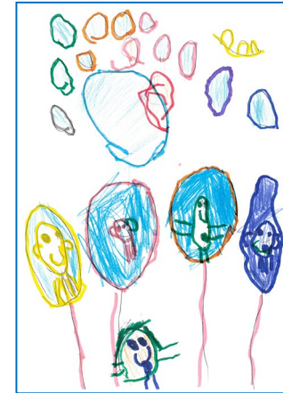
13 – Àfrica Dos Santos Ventura